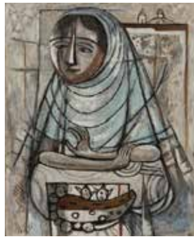
1. 北川民次《サボテンを売る女》1956年 カンヴァス、油彩