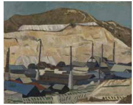
2. 北川民次《瀬戸の工場》1948年 カンヴァス、油彩