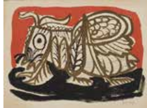
3. 北川民次《バッタ》1958年 紙、リトグラフ