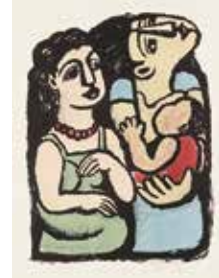
4. 北川民次《哺育》1965年 紙、リトグラフ