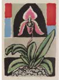
5. 北川民次《シュプリエディウム》1965年 紙、リトグラフ

※1,2は瀬戸市美術館蔵、3~5は真岡市蔵(久保コレクション) ※3,5は写真撮影:上野真道、4は写真提供:栃木県立美術館